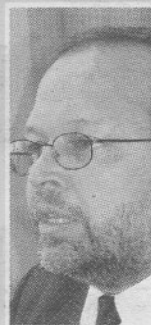
FRANCISCO DALL'ANESE FISCAL GENERAL

“Actuamos porque esto había que reventarlo de una vez por todas”