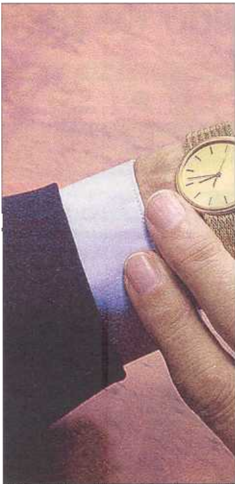
El Proyecto de Ley adelanta en 5 años la edad de jubila-

Ciertamente, esta es una de las mayores crí-