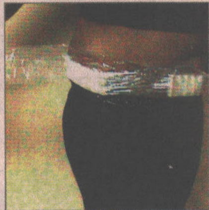
También ocultaba 18 óvulos de heroína en su cintura.