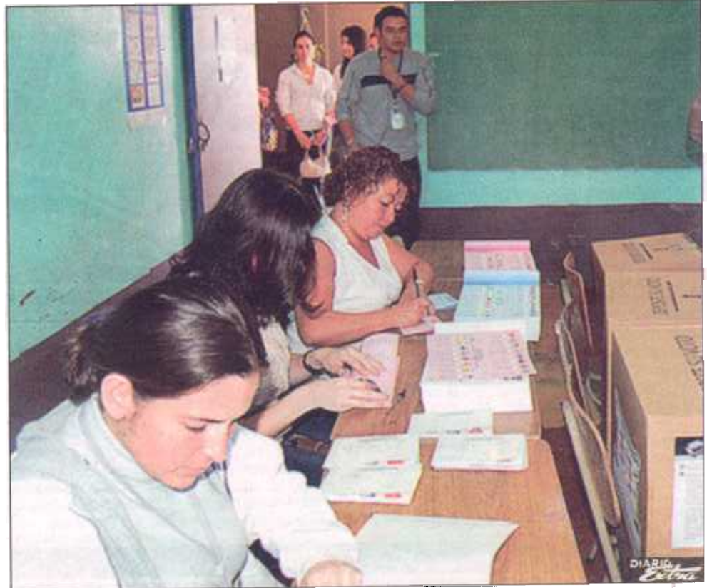
Los miembros de mesa se encargan de conducir el proceso de votación en cada junta receptora de votos. Varios de esos funcionarios inscritos en el cantón de Palmareños por el Movimiento Libertario, presentaron su renuncia ante el TSE alegando que nunca fueron consultados por ese partido.