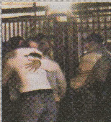
Los familiares de Mabel llegaron a su casa para ver lo que había pasado.