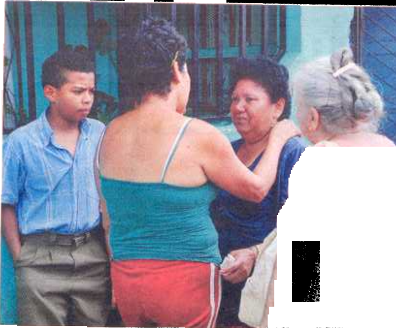
Familiares de la joven dijeron que la pareja "era feliz".