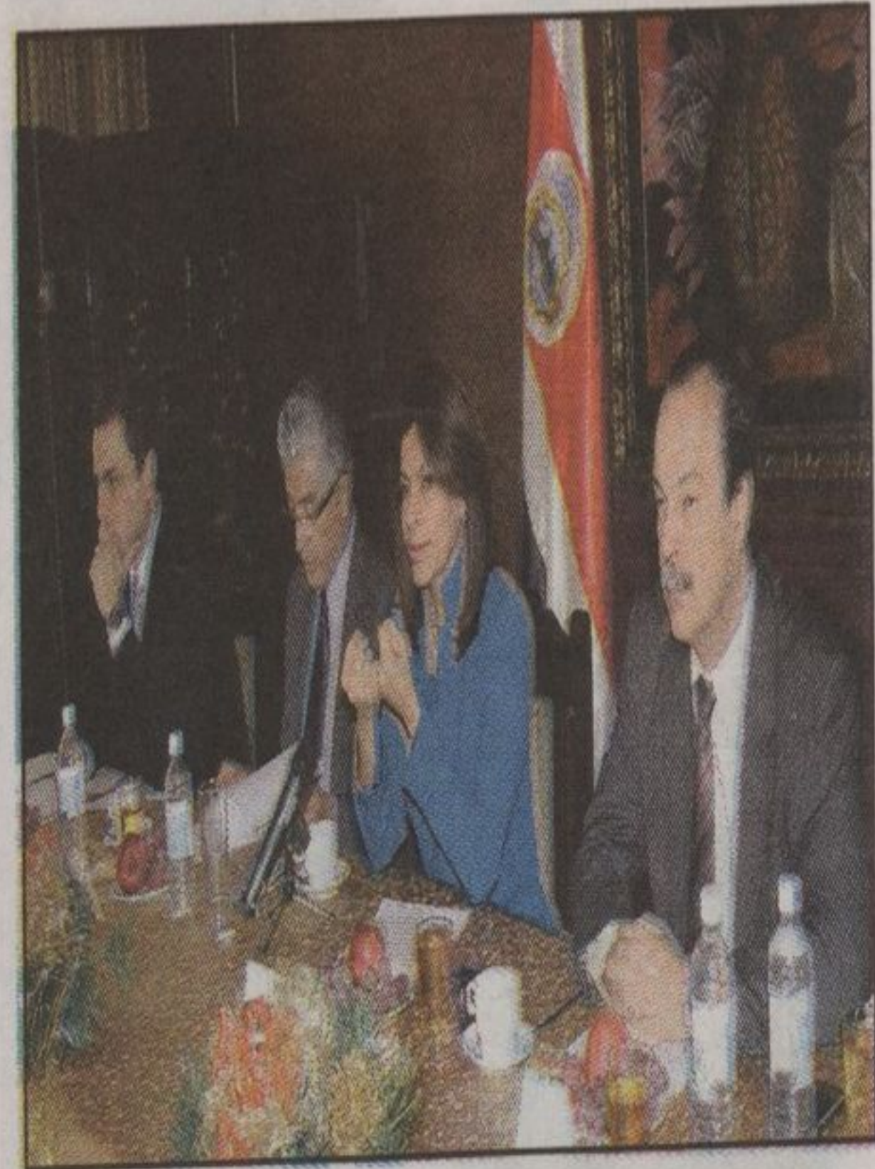
El gobierno minimizó las huelgas y aseguró que no representan un malestar generalizado sino la defensa de intereses particulares de algunos sectores.

Ante los cuestionamientos Chinchilla siempre dijo que todo era producto de que le había tocado gobernar en una época complicada para el país y la baja popularidad no le preocupaba porque se están tomando acciones complicadas pero que son las mejores para el bien de Costa Rica.