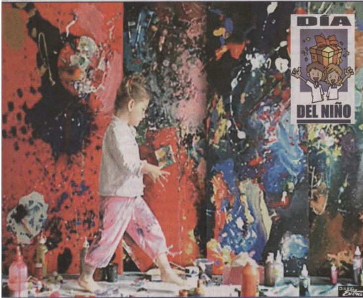
La joven artista pinta casi siempre con las manos o mediante técnicas de salpicaduras con pinceles empapados de pintura acrílica, como las utilizadas por Pollock. (SEP)

N UEVA YORK, EE.UU. (SEP).- Su color favorito es el amarillo, le gusta ponerse un tutú rosa de ballet, le interesan los dinosaurios y los planetas, tiene cinco años y llegó a Nueva York para exponer cuadros que se venderían por cantidades de cinco cifras, sin ser esta la primera vez que lo hace.