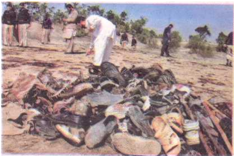
Familiares identifican pertenencias de las víctimas del atentado.

Una fuente policial explicó que un suicida hizo estallar su chaleco explosivo durante las oraciones fúnebres en la zona de Adelzai, con unas 150 personas presentes, y precisó que entre los heridos hay niños de entre 8 y 12 años.