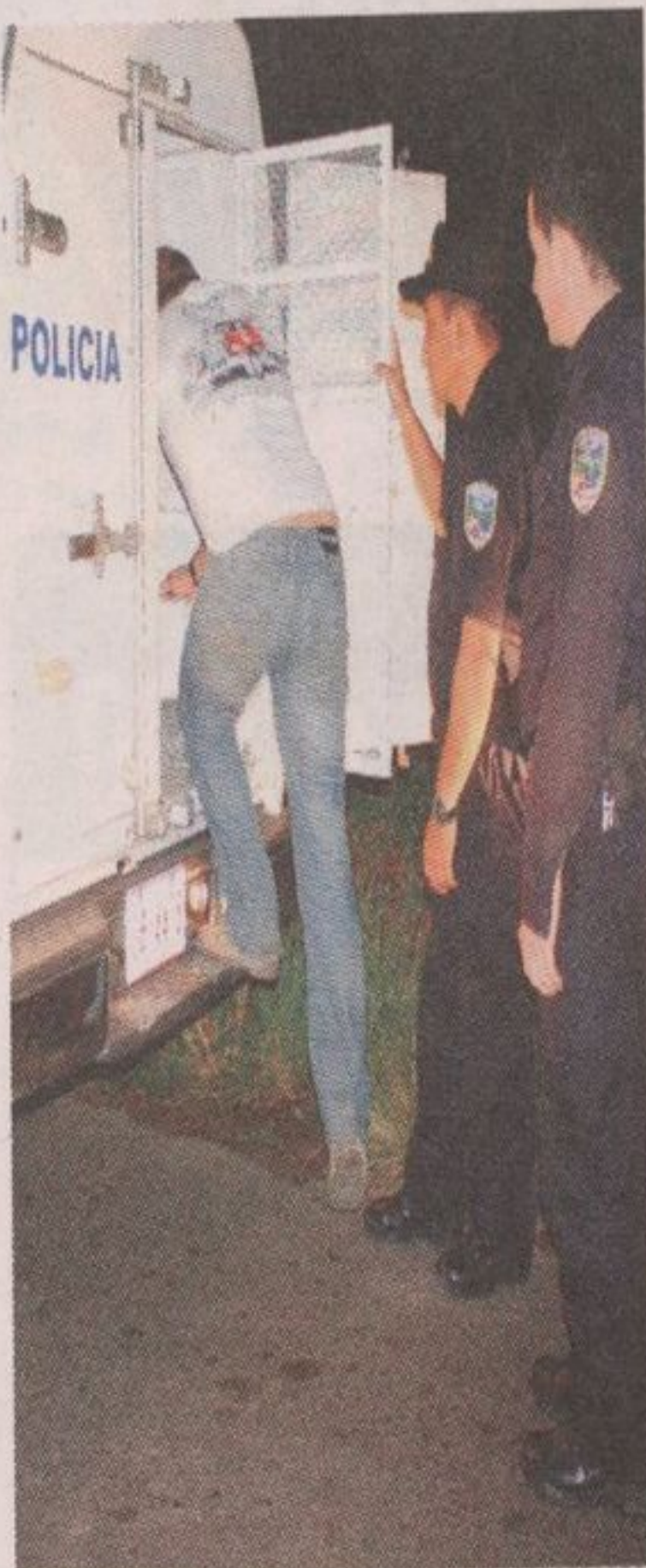
El conductor del tráiler fue detenido.