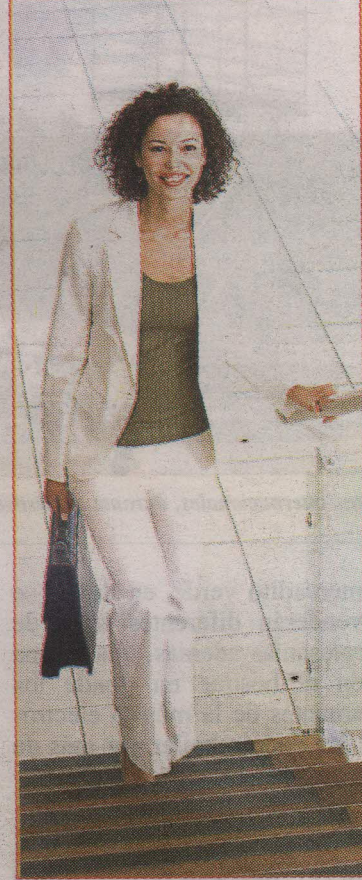
El utilizar las escaleras tonifica las piernas, glúteos y abdomen.

en que todos estos cambios tienen que ir acompañados de alimentación balanceada y una buena nutrición para incrementar la vitalidad en el cuerpo.