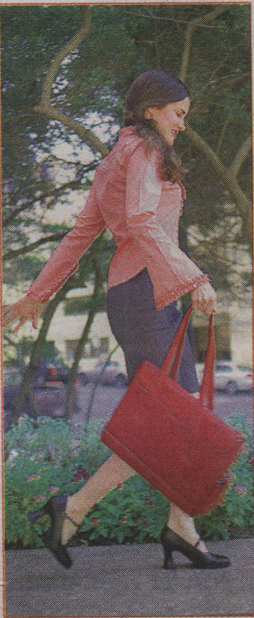
Bajarse de dos a tres paradas antes permite caminar unos 500 metros diarios.

• Tomar 13 vasos de líquido da vitalidad y energía