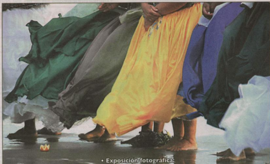
• Exposición fotográfica: