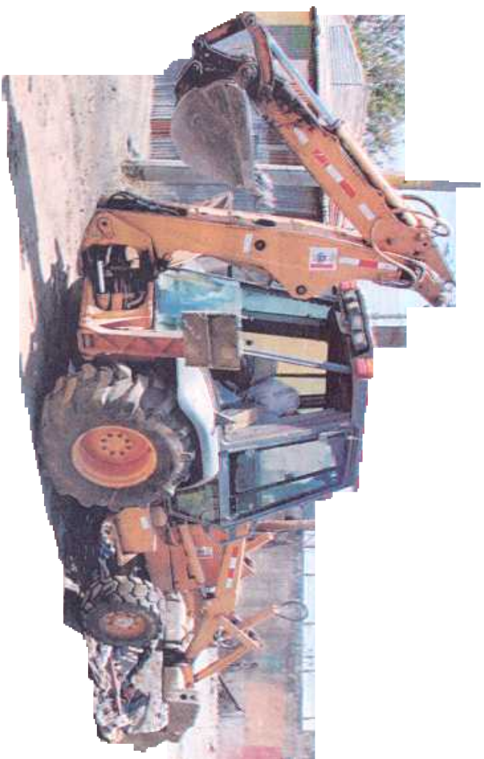
Trabajadores de la muni de Heredia ayer terminaron de limpiar el terreno.

cho, para asegurarse de que no lo vava a pasar nada mientras se de sarrolla el proceso penal contra un hombre, de apellido Badilla, quien la golpeaba a cada rato y no la dejaba ni ver la luz del sol, según reve