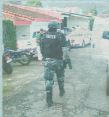
Unos 30 oficiales atendieron la emergencia.