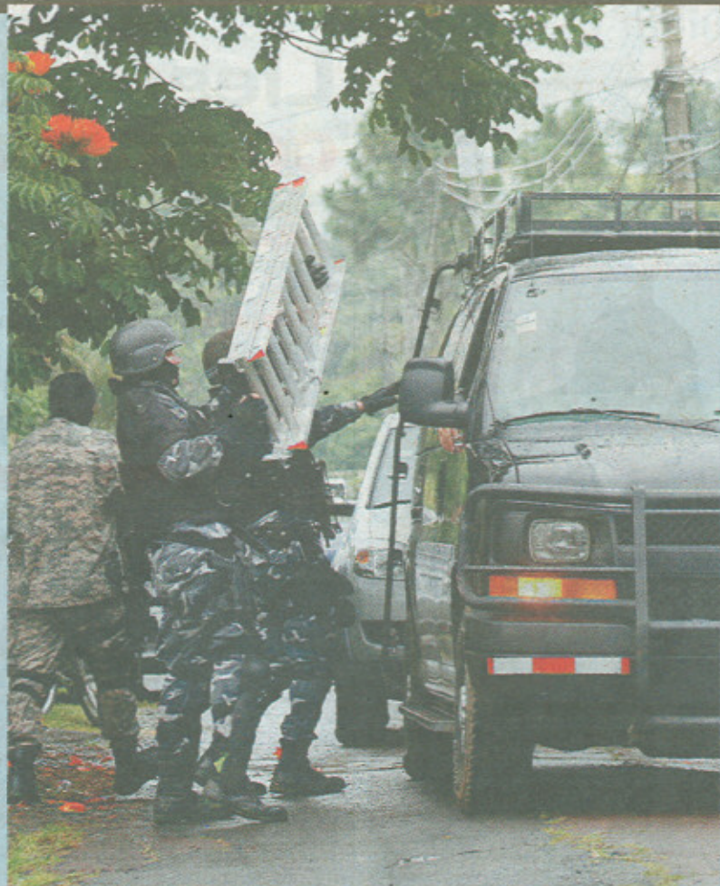
El grupo táctico tardó una hora en entrar a la casa de la familia. REBECA APRIAS LT