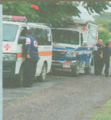
Cruzrojistas confirmaron la muerte de los pacientes.