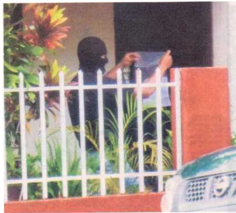
Agentes decomisaron cartas de amor en la casa de la mujer. JULIO PEÑA PARALT

Las intervenciones telefónicas también fueron claves para esclarecer el caso. En una se comprobó cómo Mora se burlaba de los agen-