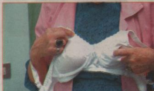
Los sustos tienen un costo de 11 mil colones y se encuentran en tallas que van de la 32 a la 42.

Fundeso se ubica 175 metros oeste de la entrada de emergencias del Hospital Nacional de Niños en Paseo Colón. En el caso de la Caja Costarricense de Seguro Social esta tiene un proyecto de clínicas para el cáncer de mama, donde también se atiende a pacientes de una forma integral.