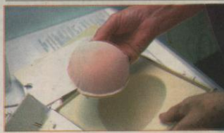
La prótesis tiene un costo de 50 mil colones y se puede encontrar en todas las tallas.

cancerígenas. Además, los enfermos de cáncer ahora cuentan con instituciones de apoyo, una de ellas es la Fundación Nacional de Solidaridad Contra el Cáncer de Mama (Fundeso). Esta ayuda a las pacientes diagnosticadas con cáncer de mama con atención médica y ayuda integral para salir adelante con su enfermedad.