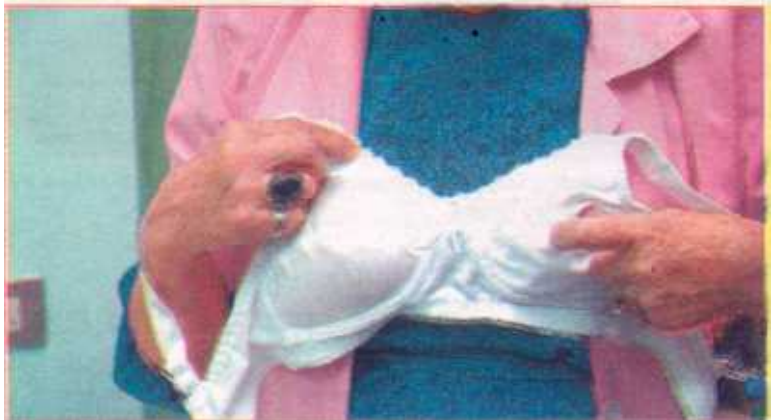
Los sostenes tienen un costo de 11 mil colones y se encuentran en tallas que van de la 32 a la 42.

Fundeso se ubica 175 metros oeste de la entrada de emergencias del Hospital Nacional de Niños en Paseo Colón. En el caso de la Caja Costarricense de Seguro Social esta tiene un proyecto de clínicas para el cáncer de mama, donde también se atiende a pacientes de una forma integral.