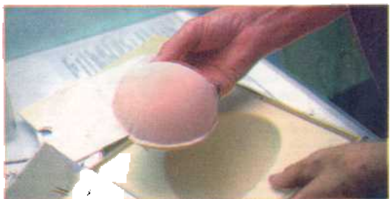
La prótesis tiene un costo de 50 mil colones y se puede encontrar en todas las tallas.