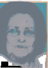
de cáncer en años de operada