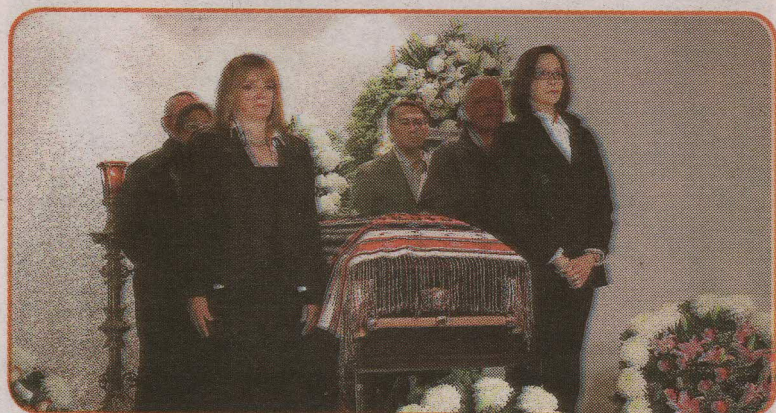
El féretro con el cuerpo de Chavela Vargas fue trasladado ayer hasta la Plaza Garibaldi, donde la Secretaría de Cultura del Distrito Federal le rindió un homenaje.