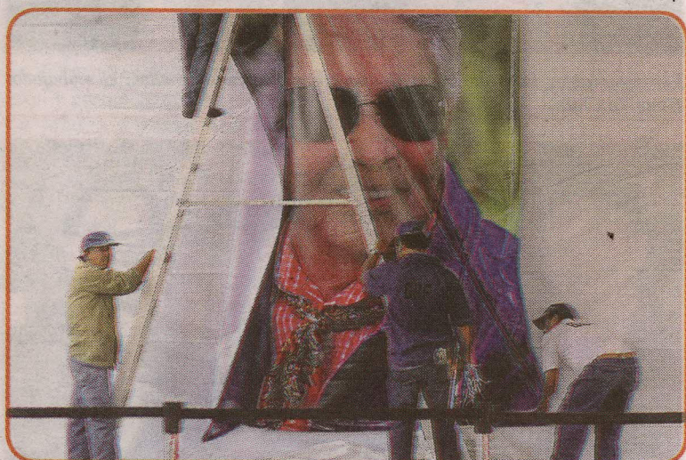
Grandes fotografías de Chavela Vargas fueron colocadas en las afueras del Palacio de Bellas Artes, donde será llevada hoy.

SYLVIA NÚÑEZ CHAVES snunez@prensalibre.co.cr