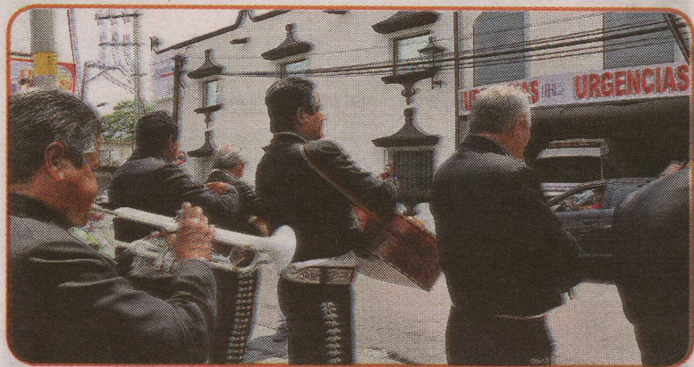
Varios mariachis le dieron una serenata en las afueras del hospital de Cuernavaca, una vez que se dio a conocer la noticia de su muerte.