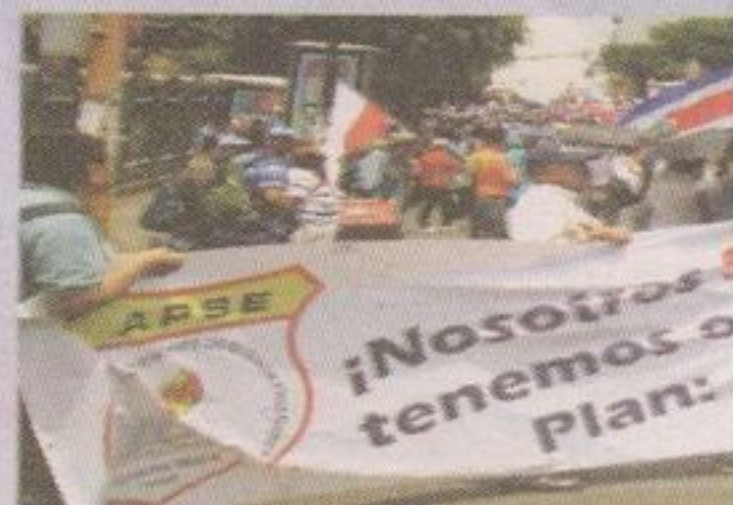
Los profesores se manifiestan