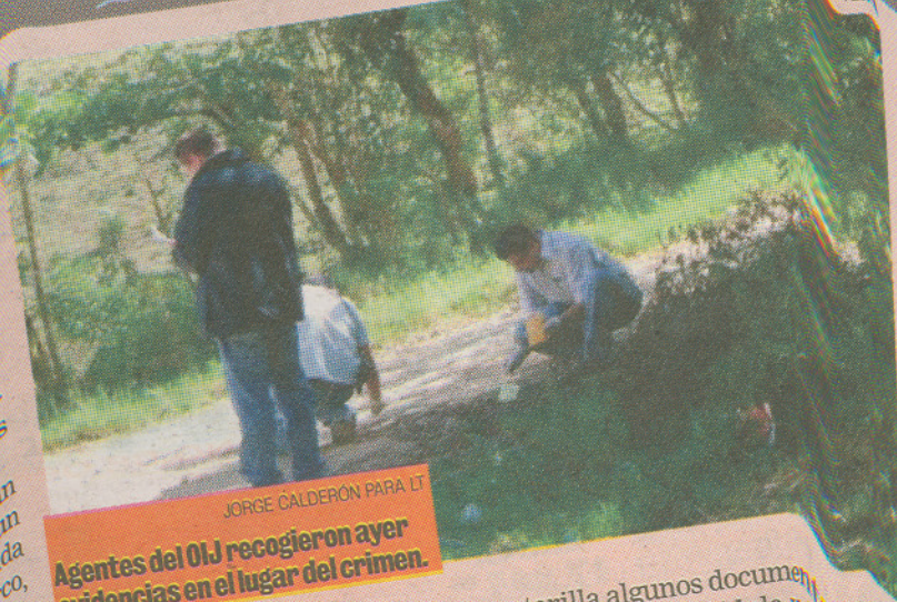
Agentes del OIJ recogieron ayer evidencias en el lugar del crimen.