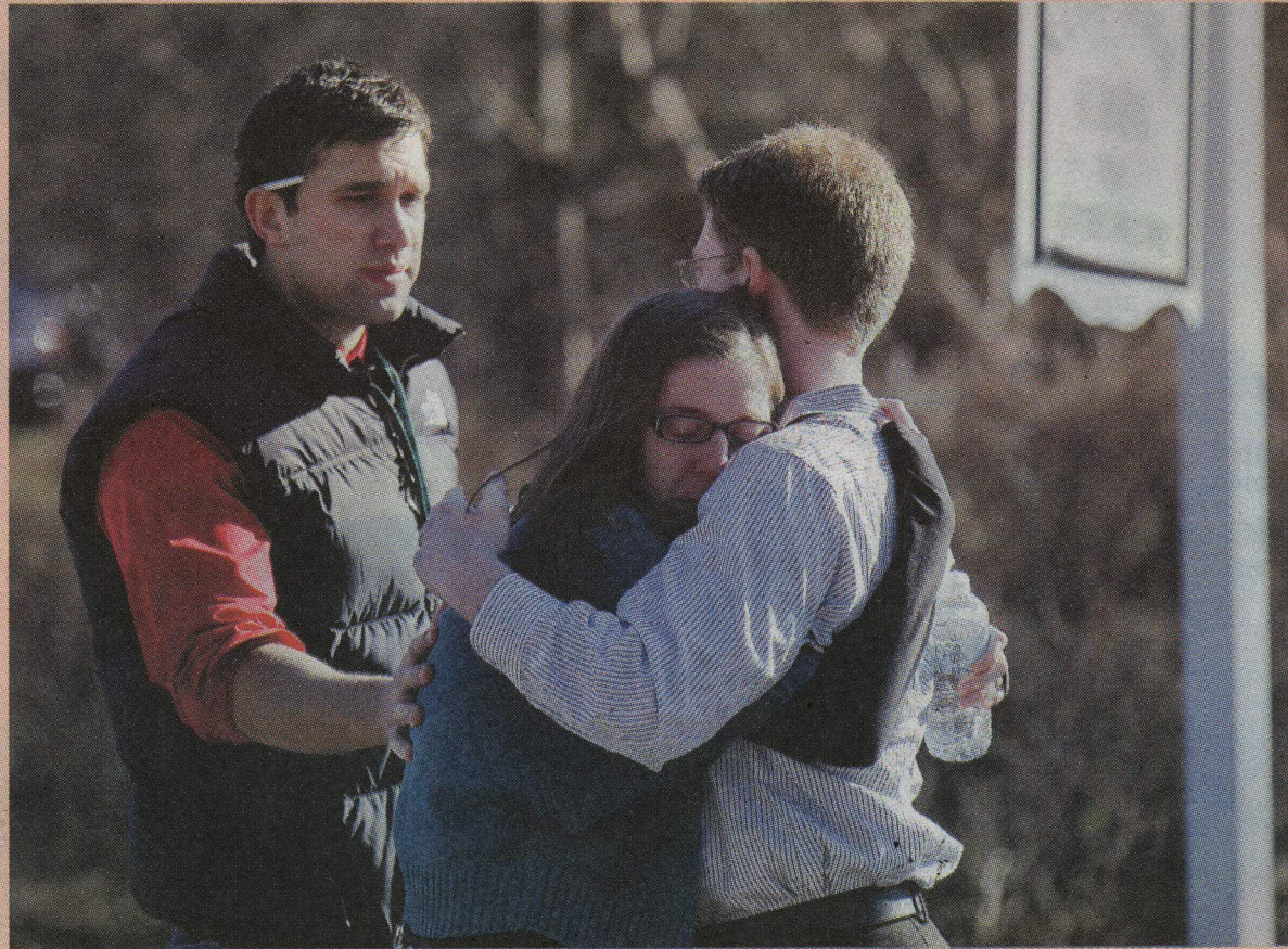
La gente estaba afectadísima cuando se supo la cantidad de muertos.