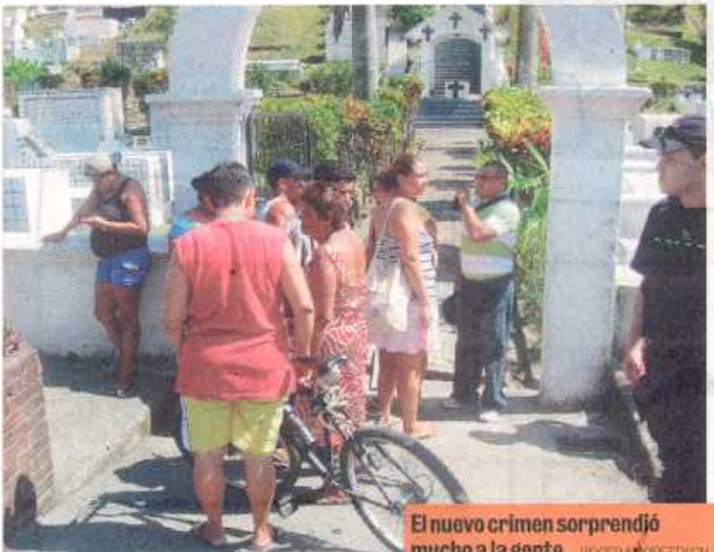
El nuevo crimen sorprendió mucho a la gente.