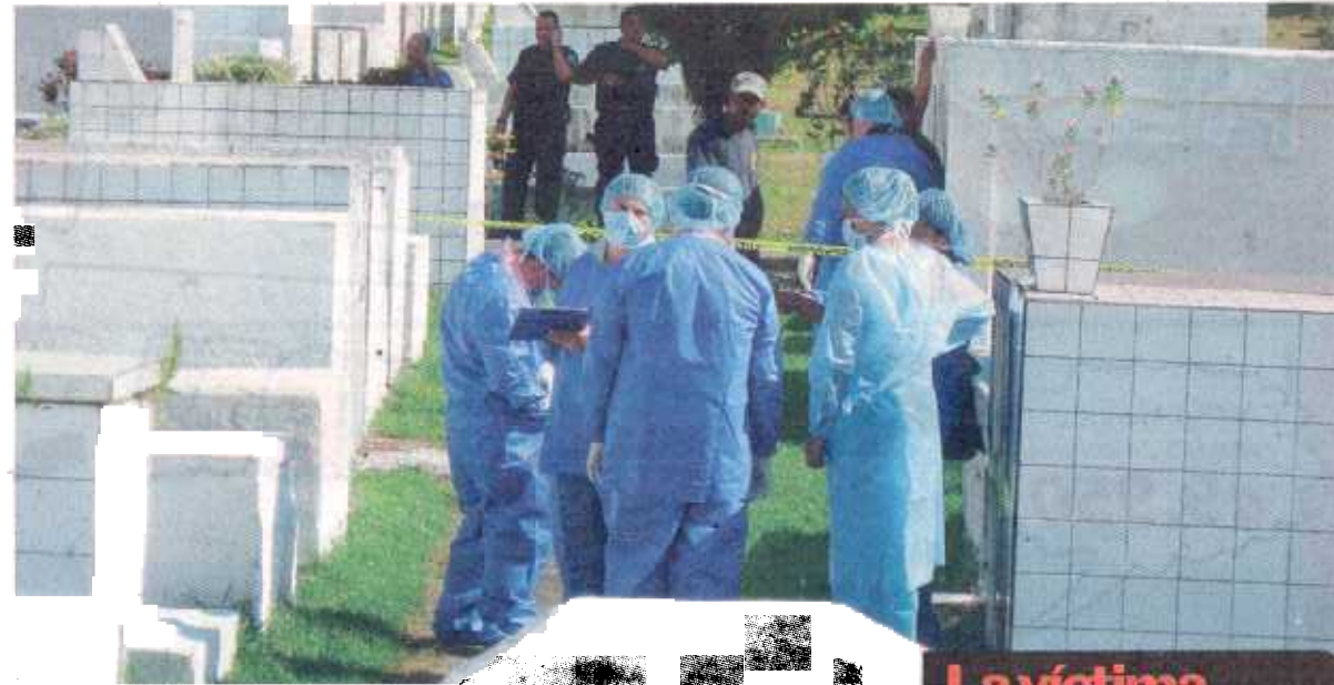
El cadáver estaba entre las tumbas.