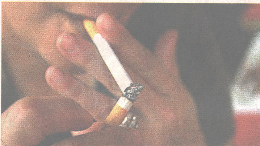
Fumar y tomar licor son dos de las causas que se pueden evitar y que podrían salvarlo de padecer osteoporosis.

Para tener un mejor resultado en el tratamiento la persona con osteoporosis debe dejar de fumar, evitar las bebidas alcohólicas y mantenerse en un peso adecuado, ya que las personas muy