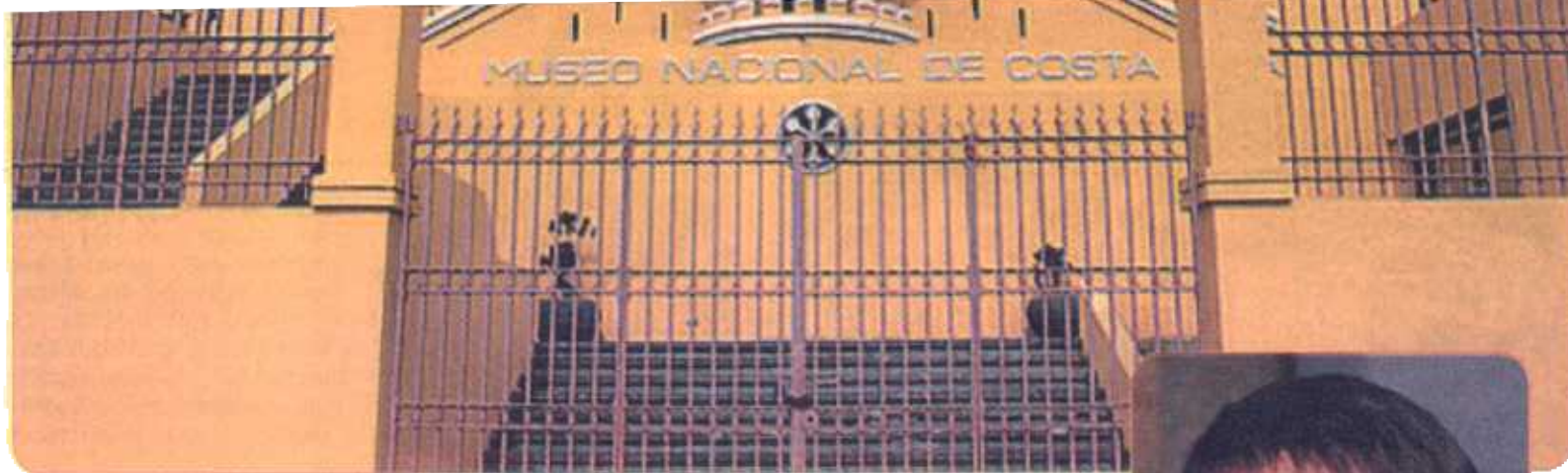
En el Museo Nacional se encuentra toda la historia patrimonial del país.

“Yo acepté porque creo que es una buena decisión ya que aunque existan dos subdirecciones hay un solo mandato, lo que agilizaría todo el trabajo que se hará por el