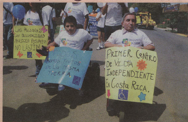
Algunos se movilizaron en sillas eléctricas. ALEJANDRO MÉNDEZ