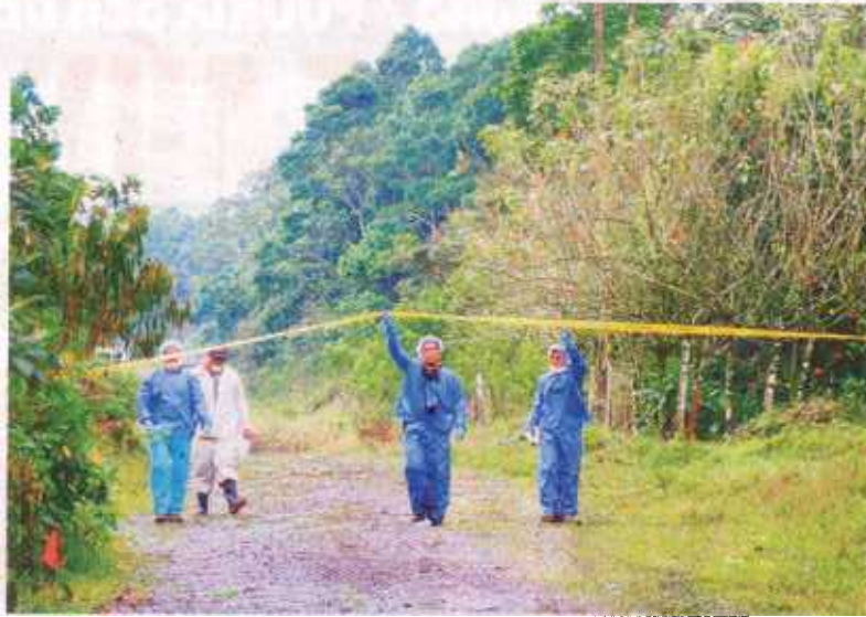
Doce agentes participaron en el levantamiento.