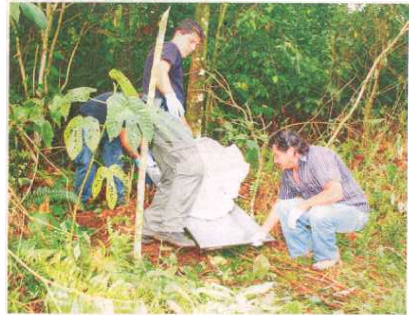
El cuerpo estaba a doce metros de la calle.

Tenía seis años de trabajar en la escuela de San Antonio del Humo, en La Roxana.