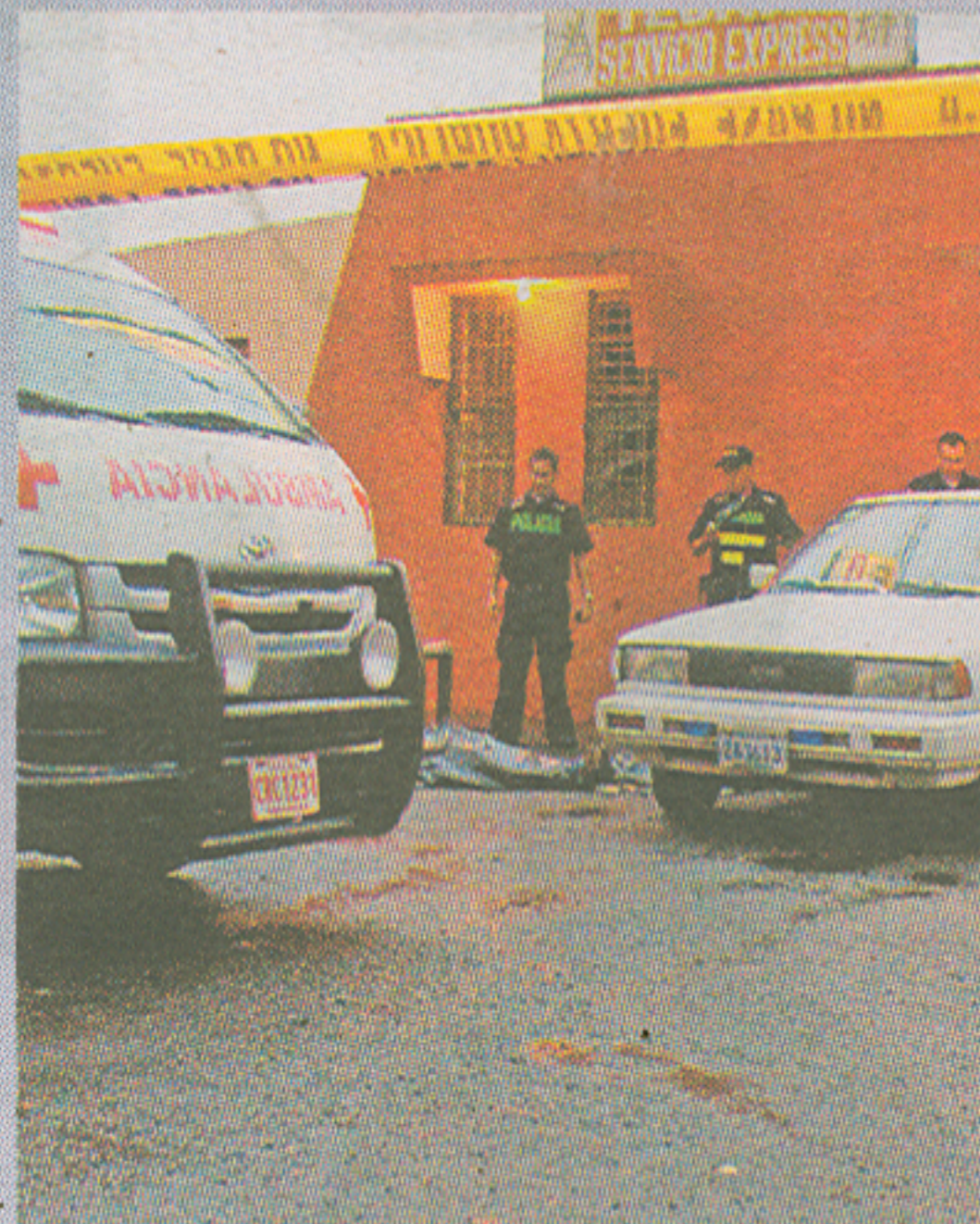
Salguera quedó sin vida frente al bar Las Tejitas.

Hasta allí llevaron por unos minutos los ataúdes. Primero el de la