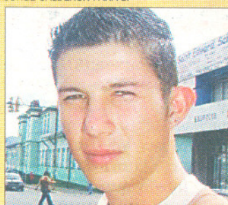
JORGE CALDERÓN PARA LT