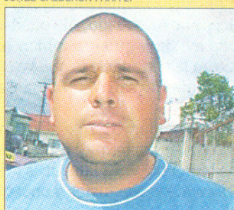
JORGE CALDERÓN PARA LT