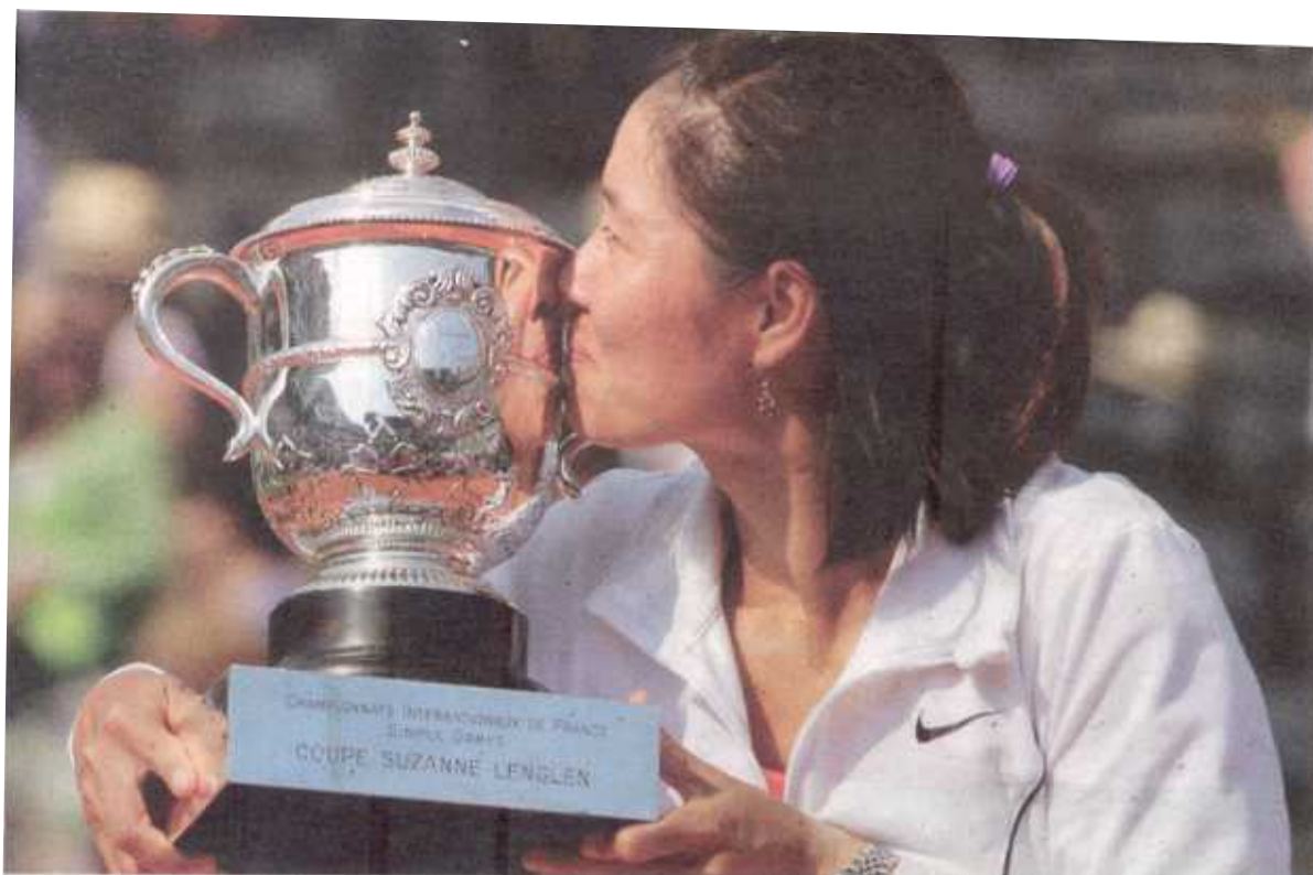
Li Na a sus 29 años consumó su victoria más importante en el tenis mundial. Esta jugadora asiática alcanzará mañana su mejor posición en el ranking, número cuatro, luego de 12 años como jugadora profesional.