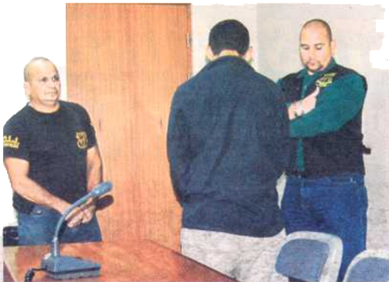
El pinolero fue condenado ayer en la mañana.

Según el tribunal de Golcochea, el condenado de 28 años, escogía a las víctimas en las paradas de buses en Curridabat y les entraba con el cuento de ofrecerles trabajo. Luego, con engaños, acompañaba a las víctimas a pie y cuando veía un lugar oscuro las metía a la fuerza y abusaba de ellas. En algu-