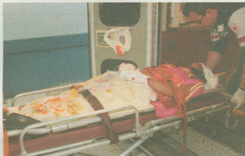
La mujer llegó toda cortada al hospital San Juan de Dios.