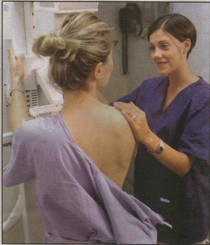
Las mamografías son de los exámenes más importantes que se deben realizar las madres para evitar el cáncer de seno.

ALVARO CALDERÓN PANIAGUA acalderon@prensalibre.co.cr