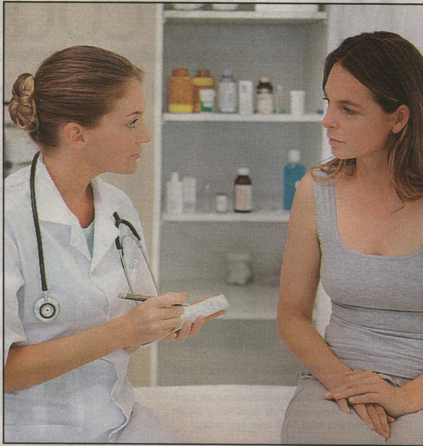
Una consulta médica por lo menos una vez al año es indispensable en las madres.