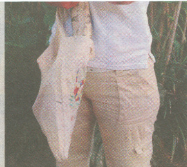
ALONSO TENORIO LT

Esta pitón tigrina pesa 85 kilos y mide 7 metros de largo, es muy consentida también.