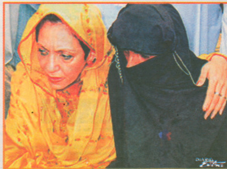
En una de sus primeras apariciones en público, vemos a Mukhtar cubriéndose el rostro pero empezando a denunciar su caso ante los periodistas, acompañada de su madre. (SEP)

De tal vacío, de esa tragedia, brotó una insólita vida.