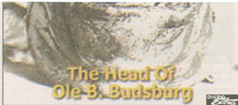
La cabeza de Ole B. Budsberg, otro infeliz enamorado que pagó con su vida los momentos que paso junto a Belle (SEP).

Los cuerpos de estos dos desaparecidos se encontraron en la granja y otros muchos más. Todos los cadáveres se encontraban desmembrados. Aparecieron también los zapatos de una mujer y un bolso, los cuales debieron pertenecer a la mujer no identificada que se descubrió anteriormente. Resultó especialmente duro el descubrimiento de los restos mortales de un