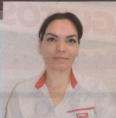
Gendry no tenía golpes ni abusaron sexualmente de ella.

Gendry no ha dicho nada de los sujetos, cómo eran, qué le dijeron o si le pidieron dinero. Según su cu-