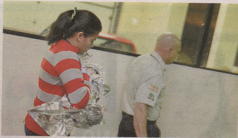
El llanto le salvó la vida a la criaturita.

A la pequeñita la llevaron a la estación de bomberos y de allí la mandaron al Hospital Niños, don-