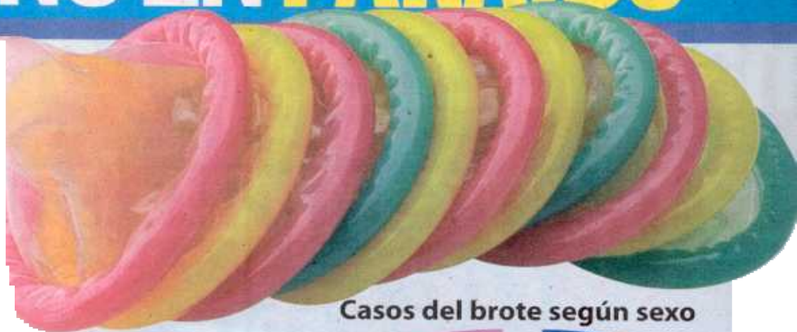
Casos del brote según sexo

El condón es indispensable para prevenir el contagio.