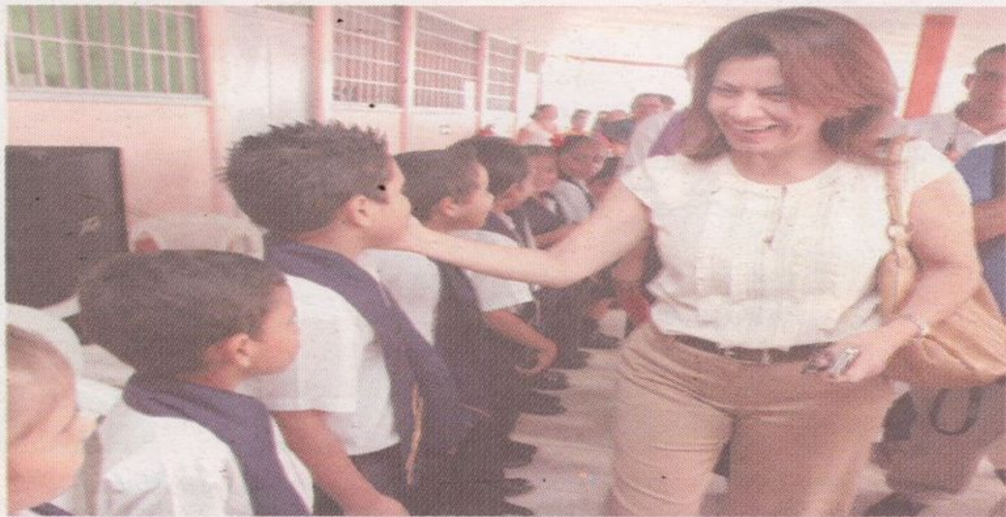
La agenda de la presidenta Laura Chinchilla ha estado plagada de inauguraciones y de su participación en actos públicos. El viernes pasado asistió al aniversario del cantón de Aguirre, donde saludó a los niños de la Escuela Inmaculada.