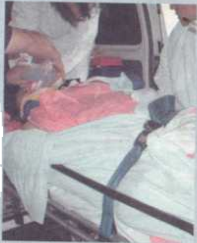
Herrera falleció al ingresar al hospital México.

Al cierre de edición nadie confirmó si los criminales se llevaron algo. Se supo que doña Sonia conta-