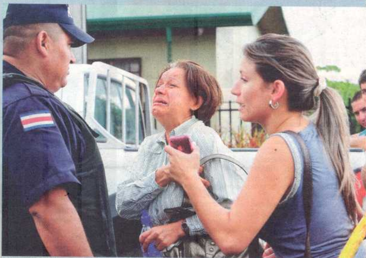
Familiares de las hermanas Rodríguez estaban desconsolados.