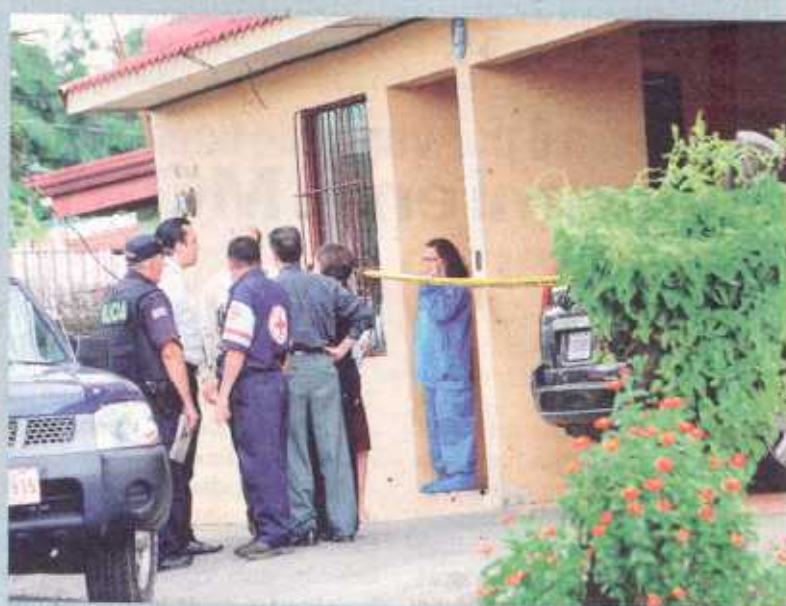
Dos de los cuerpos quedaron en la planta baja y uno en el segundo piso.