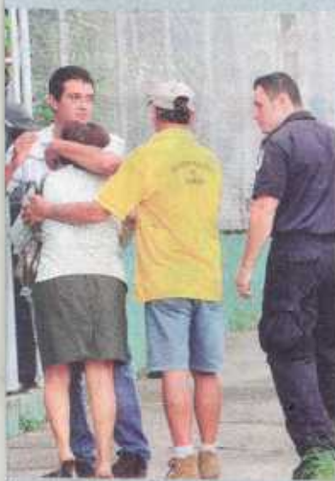
El pueblo de San Joaquín se encuentra muy dolido.