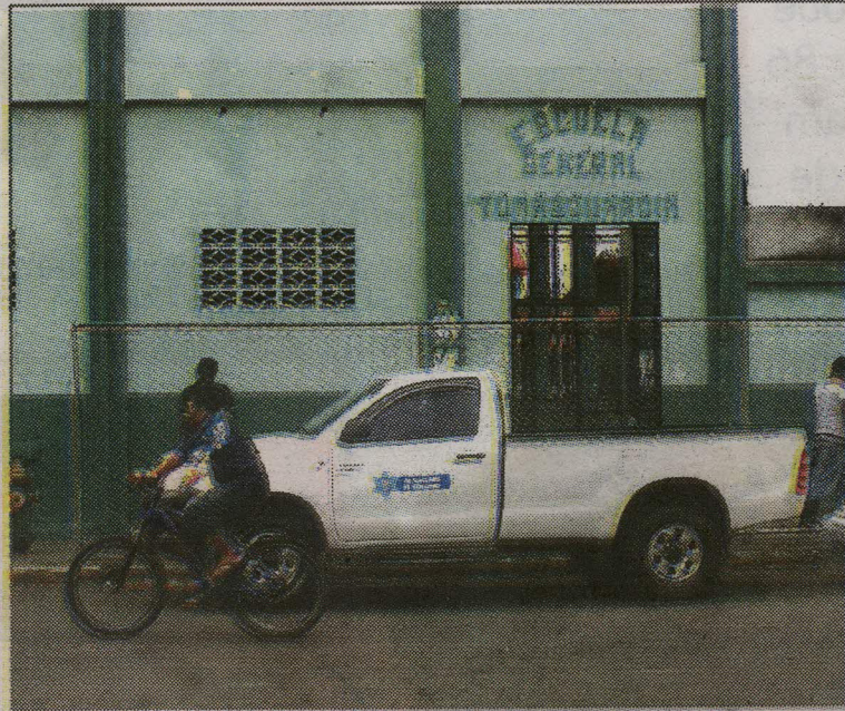
El hallazgo se realizó en la Escuela General Tomás Guardia, Limón.

una investigación para averiguar si la madre del menor es una estudiante de la escuela nocturna o de una alumna de sexto año diurno.