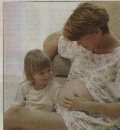
Desde el momento en que los niños comiencen a hacer preguntas sobre sexualidad se les debe hablar con sinceridad, lógicamente tomando en cuenta su edad.

car la totalidad del ser humano, no solo los aspectos físicos, se trata de preparar a los jóvenes para el futuro y aunque hagan un pregunta sencilla, es necesario contestar de manera integral acerca del cómo, pero también del porqué.