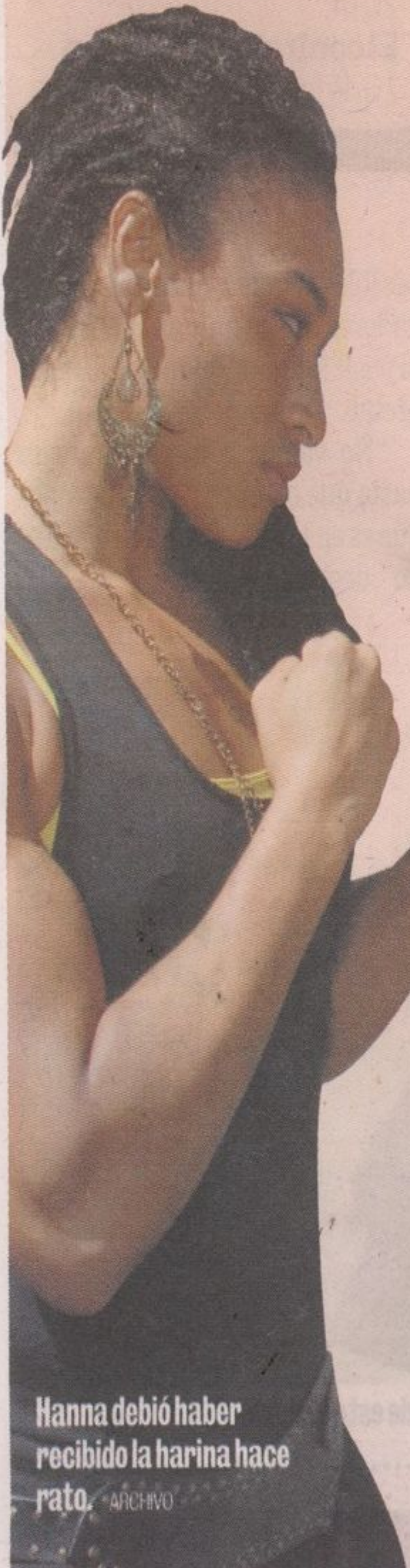
Hanna debió haber recibido la harina hace rato.

El Gobierno bueno para celebrar pe malo cuando trata de so el güevo. A