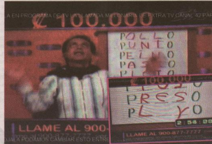
El pasado lunes 18 de junio fue el día del polémico concurso. TOMADO DE INTERNET.