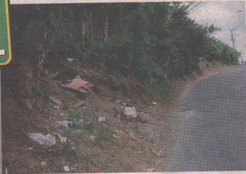
El cuerpo lo encontraron unos vecinos en esta calle en Paso Hondo.

que era imposible que pasara un bus por ese lugar, ya que la carretera que va a Alajuela estaba cerrada en ese momento por unos trabajos que estaban haciendo.