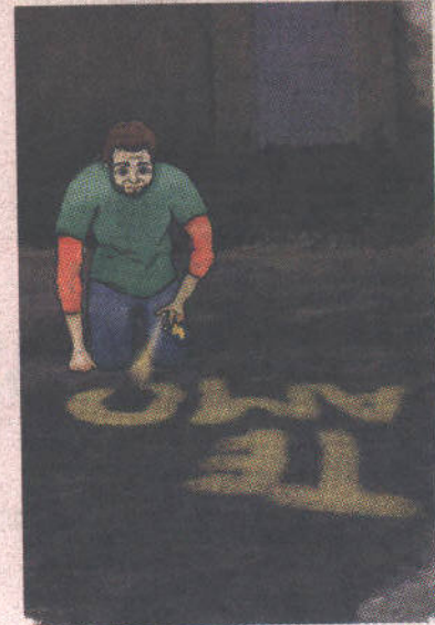
Rojas escribió "Te amo" con spray.