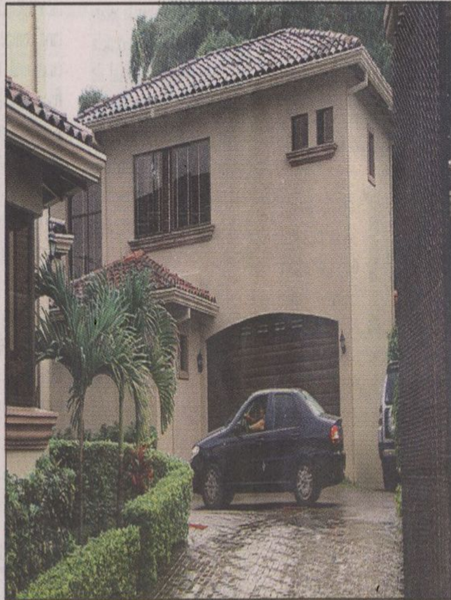
La vivienda del exprecandidato presidencial Otto Guevara fue allanada por los agentes judiciales.