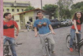
El recorrido ese estima que dure entre una hora u hora y media.