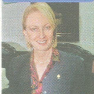
Ofelia Taitelbaum Yoselewich DIPUTADA PLN