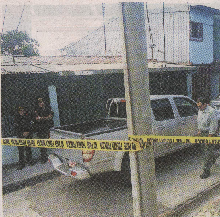
Días atrás el OIJ encontró un machete en la casa del sospechoso.