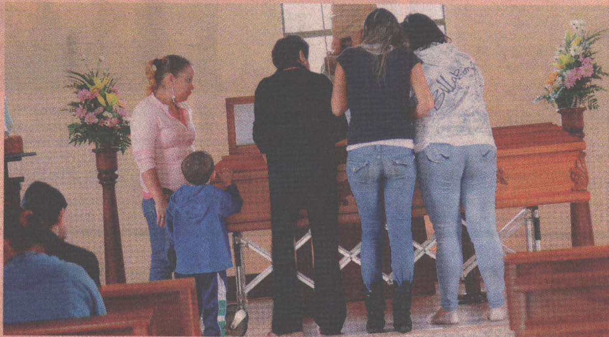
La joven fue velada ayer por la tarde en la capilla de la iglesia de El Carmen de Goicoechea.

Raúl Rivera, jefe policial de San José, confirmó que al pistolero lo